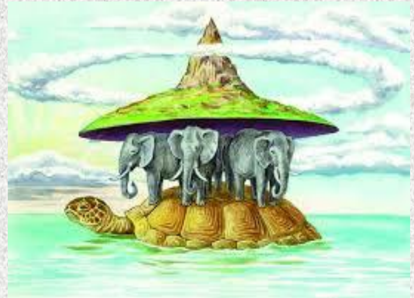
Уявлення про Землю в Давній Індії