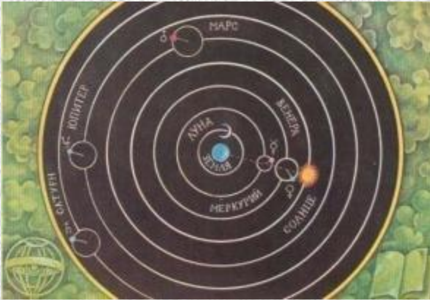
Уявлення про Всесвіт за Птолемеєм