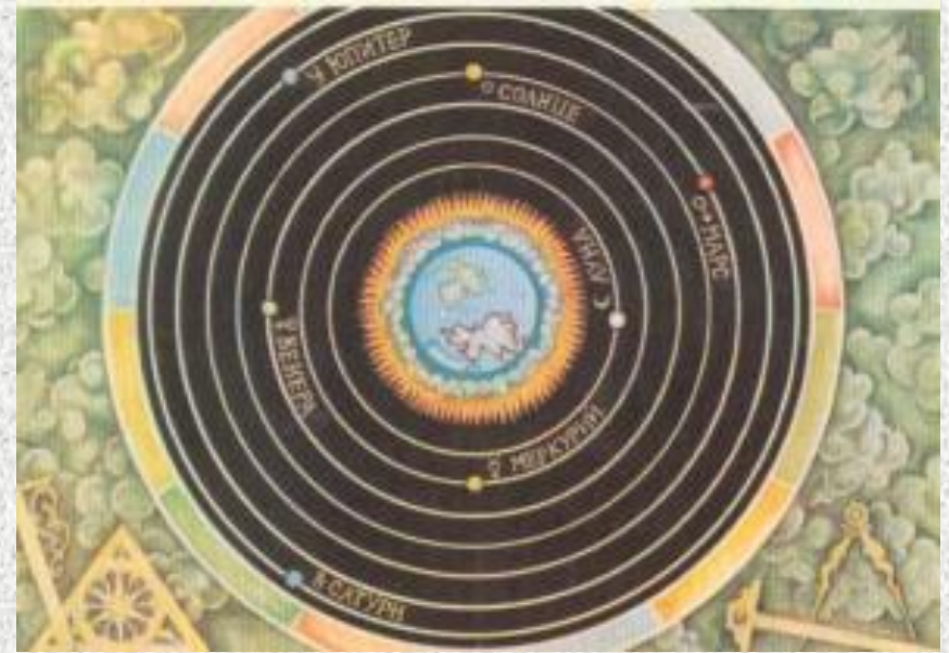
Уявлення про Всесвіт за Арістотелем