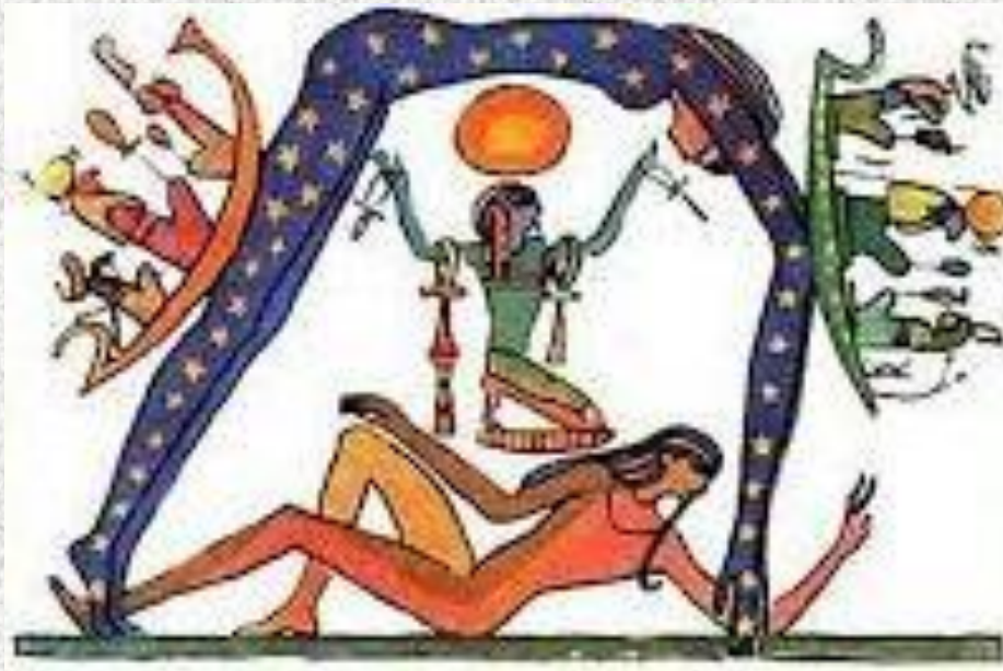
Земля в уяві стародавніх єгиптян