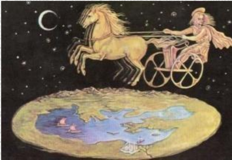
Уявлення про Землю в Давній Греції