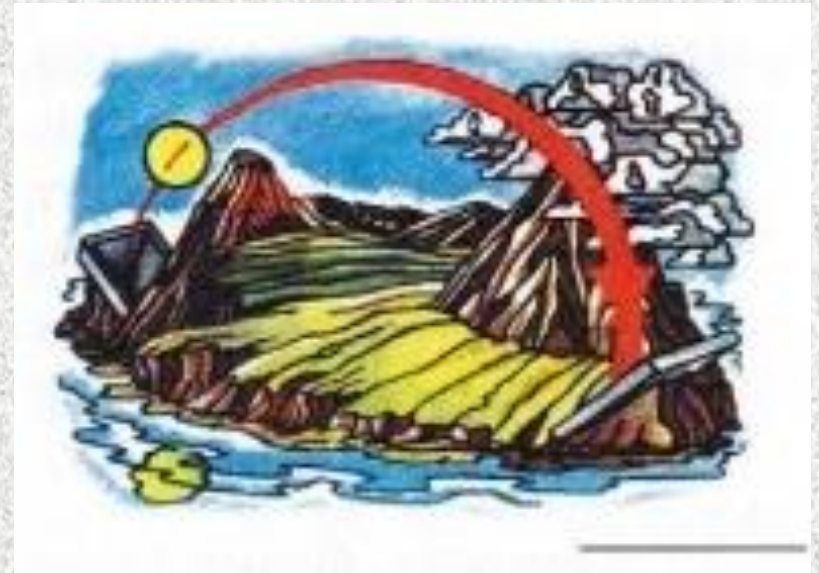
Уявлення про Землю в Стародавньому Вавілоні